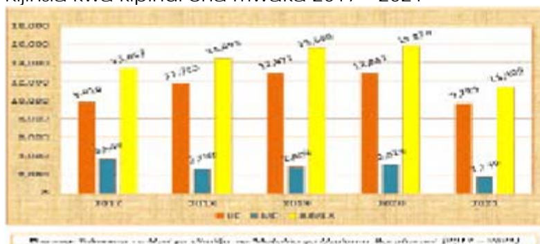
Chanzo: Takwimu za Hali ya Ukatili na Mutekwa ya Usufuria Barabara (2017 – 2021)

Kielelezo Na. 2: Idadi ya Watoto Waliofanyiwa Ukatili wa Kijinsia kwa kipindi cha mwaka 2017 – 2021